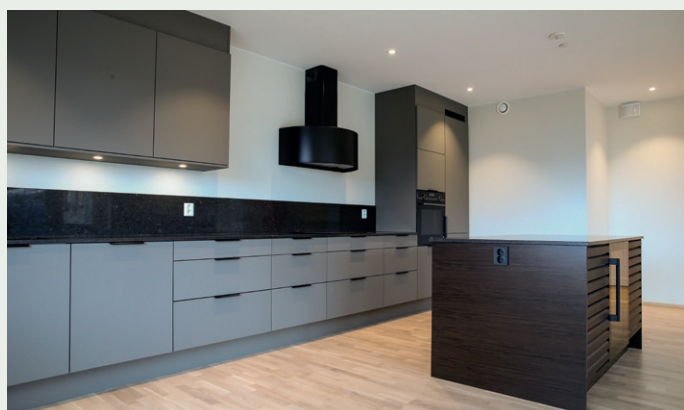
HTH har levert kjøkken til Daaehagen.