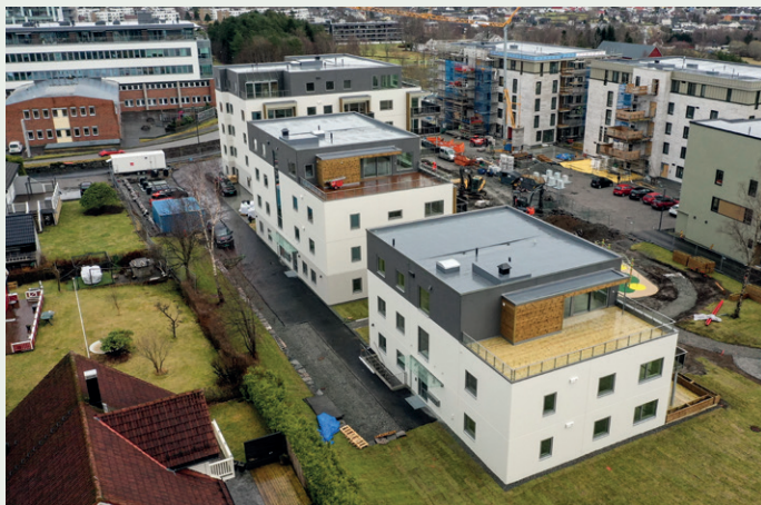
Daaehagen sett fra nordvest med kjøpesenterområdet Moa i venstre bildekant og Daaetunet som bygges av Christie Opsahl til høyre.