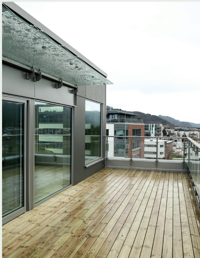
Utsikt fra takterrassen til leiligheten på 92,5 kvadratmeter mot kjøpesenterområdet Moa og drikkevannskilden Brusdalsvatnet.

Han sier flyten på byggeplassen side om side med et annet byggeprosjekt, tross alt har gått bra.