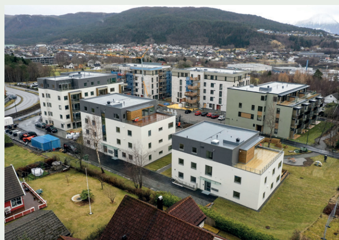
Veidekke-prosjektet Daaehagen sett i droneperspektiv fra nordvest med Daaetunet som bygges av Christie Opsahl bak.