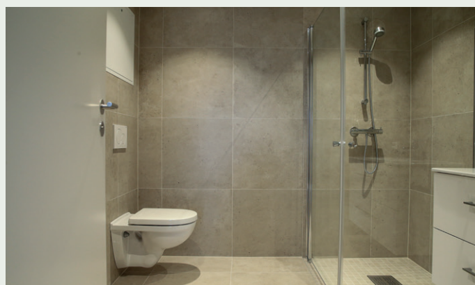
Badene har fliser på gulv og vegger.

Alt av rekkverk er levert og montert av oss