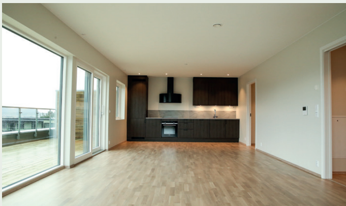
Leilighetene i Daaehagen har parkett på gulv, HTH-kjøkken og sparklet og malt gips på vegger og i tak. Denne leiligheten på 92,5 kvadratmeter har utgang fra oppholdsrom til egen takterrasse.