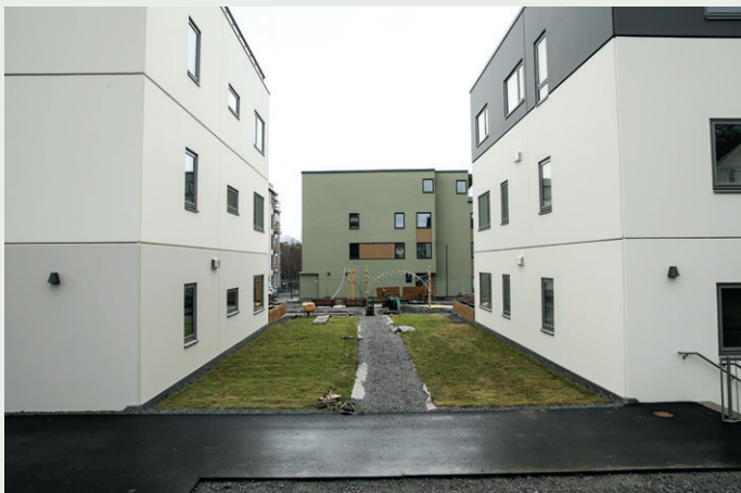
Uteområdet med lekeapparat er en del av kontrakten Veidekke har med utbygger Planor. Aco Anlegg er anleggsgartner.

i stue, kjøkken og gang. Badene har varmekabler. Fjernvarmen varmer også forbruksvann.