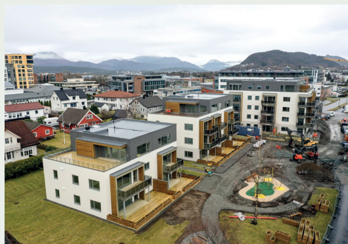
Daaehagen sett fra sørvest. Toppleilighetene har egen takterrasse. Fasaden er malte betongelementer med innslag av treverk.