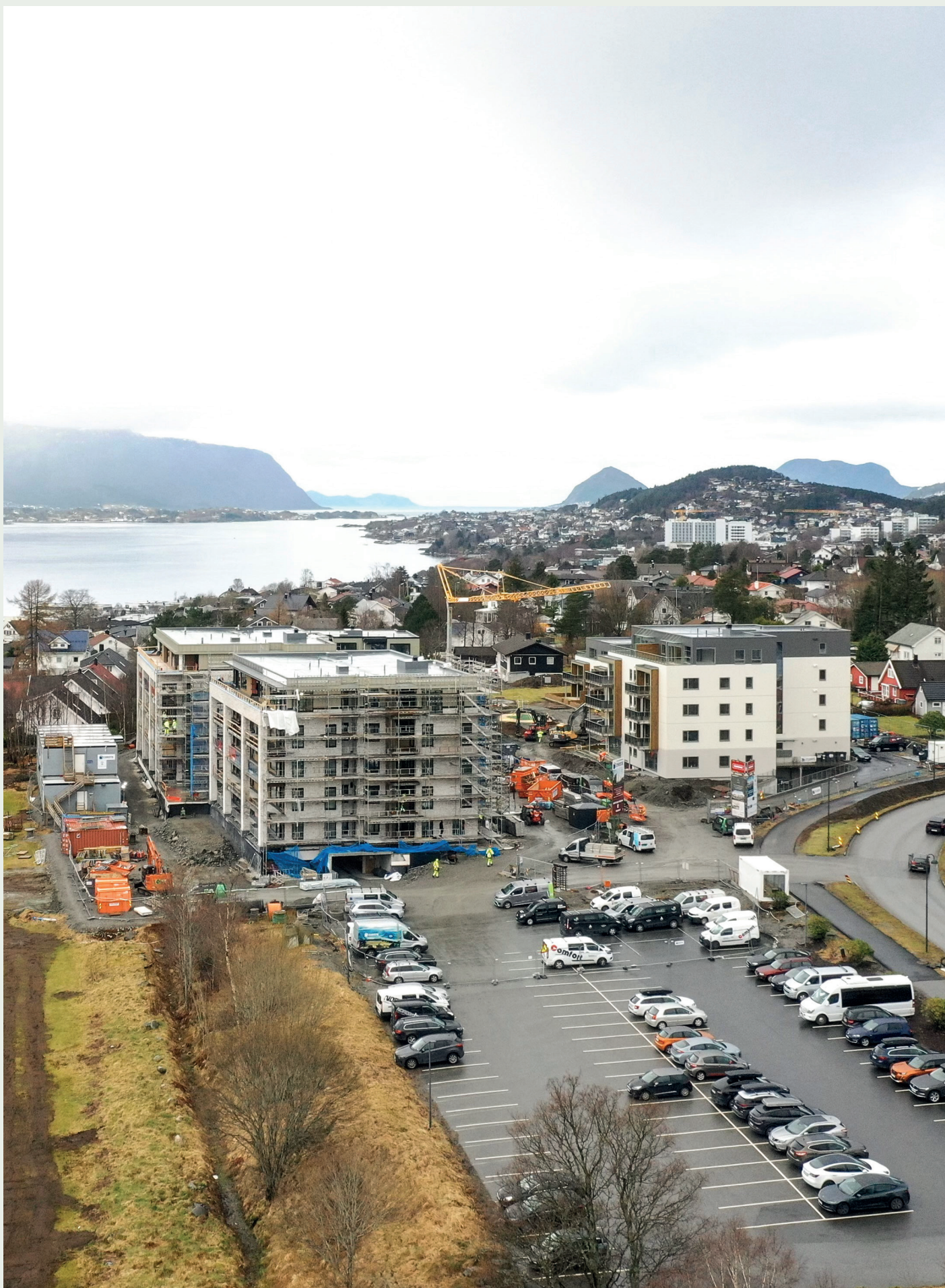
Området med Daaehagen og Daaetunet sett fra øst i retning Ålesund sentrum, med golfbanen til venstre og deler av kjøpesenteret Moa til høyre. Nede ved fjorden ser vi Borgundfjordvegen Panorama som Byggeindustrien nylig omtalte. Midt i bildet til høyre Ålesund sjukehus.