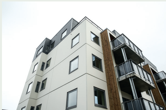
Malte betongelementer fra Elementpartner, vinduer fra Nordvestvinduet og glassrekkverk fra Vatnesenteret på denne delen av fasaden.

– Byggherre tenkte i utgangspunktet bindingsverk med platekledning på yttervegger. Vi hadde en bereg-